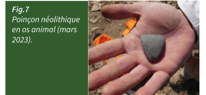
Fig. 7 Poinçon néolithique en os animal (mars 2023).

creusements témoignent d'une réoccupation du site à l'époque romaine, plusieurs millénaires après l'abandon du village néolithique. Le mobilier découvert dans les structures et les niveaux néolithiques est abondant et bien conservé. Il se compose principalement de tessons de poterie, d'outils en roches siliceuses (pointes de flèches, grattoirs et racloirs) et métamorphiques (haches polies : fig. 6), d'outils en matière animale (fig. 7) et de restes de repas (ossements de mammifères terrestres, coquillages, vertèbres de poissons).