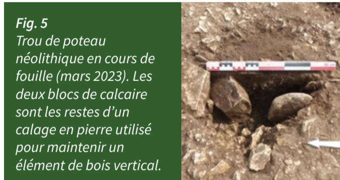
Fig. 5 Trou de poteau néolithique en cours de fouille (mars 2023). Les deux blocs de calcaire sont les restes d'un calage en pierre utilisé pour maintenir un élément de bois vertical.

Les élévations de ces bâtiments ne sont malheureusement pas conservées mais les fondations permettent de restituer certaines techniques de construction ainsi que les plans utilisés par les populations du Néolithique. Ces plans sont ceux de constructions quadrangulaires solidement ancrées dans le sol puisque les fondations de certains poteaux peuvent atteindre plus d'un mètre de profondeur pour un mètre de diamètre !