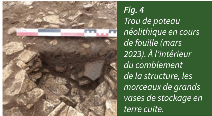
Fig. 4 Trou de poteau néolithique en cours de fouille (mars 2023). À l'intérieur du comblement de la structure, les morceaux de grands vases de stockage en terre cuite.

Une fois fouillées, il est possible de déterminer la nature de ces creusements (fosses, foyers, trous destinés à recevoir des poteaux de bois, etc.). La plupart des structures repérées sur le terrain sont interprétées comme des trous de poteau constituant l'armature de constructions de terre et de bois (fig. 4 et 5).