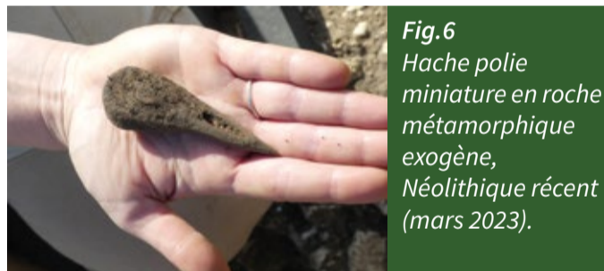
Fig. 6 Hache polie miniature en roche métamorphique exogène, Néolithique récent (mars 2023).

Les élévations de ces bâtiments ne sont malheureusement pas conservées mais les fondations permettent de restituer certaines techniques de construction ainsi que les plans utilisés par les populations du Néolithique. Ces plans sont ceux de constructions quadrangulaires solidement ancrées dans le sol puisque les fondations de certains poteaux peuvent atteindre plus d'un mètre de profondeur pour un mètre de diamètre !