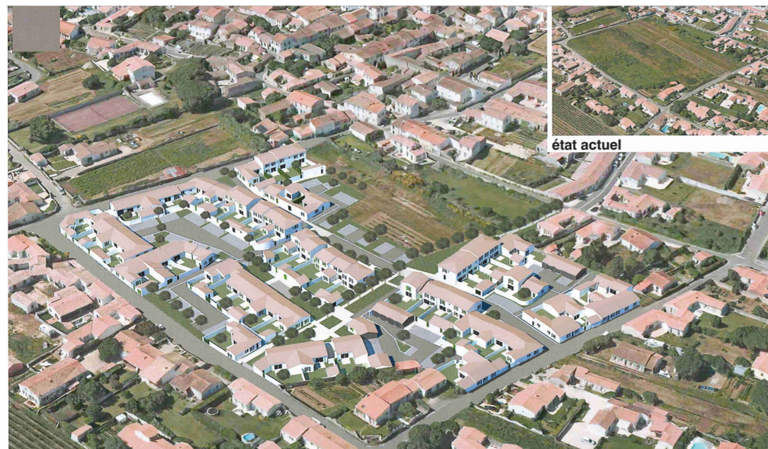
Plan des futures maisons des Faugeroux