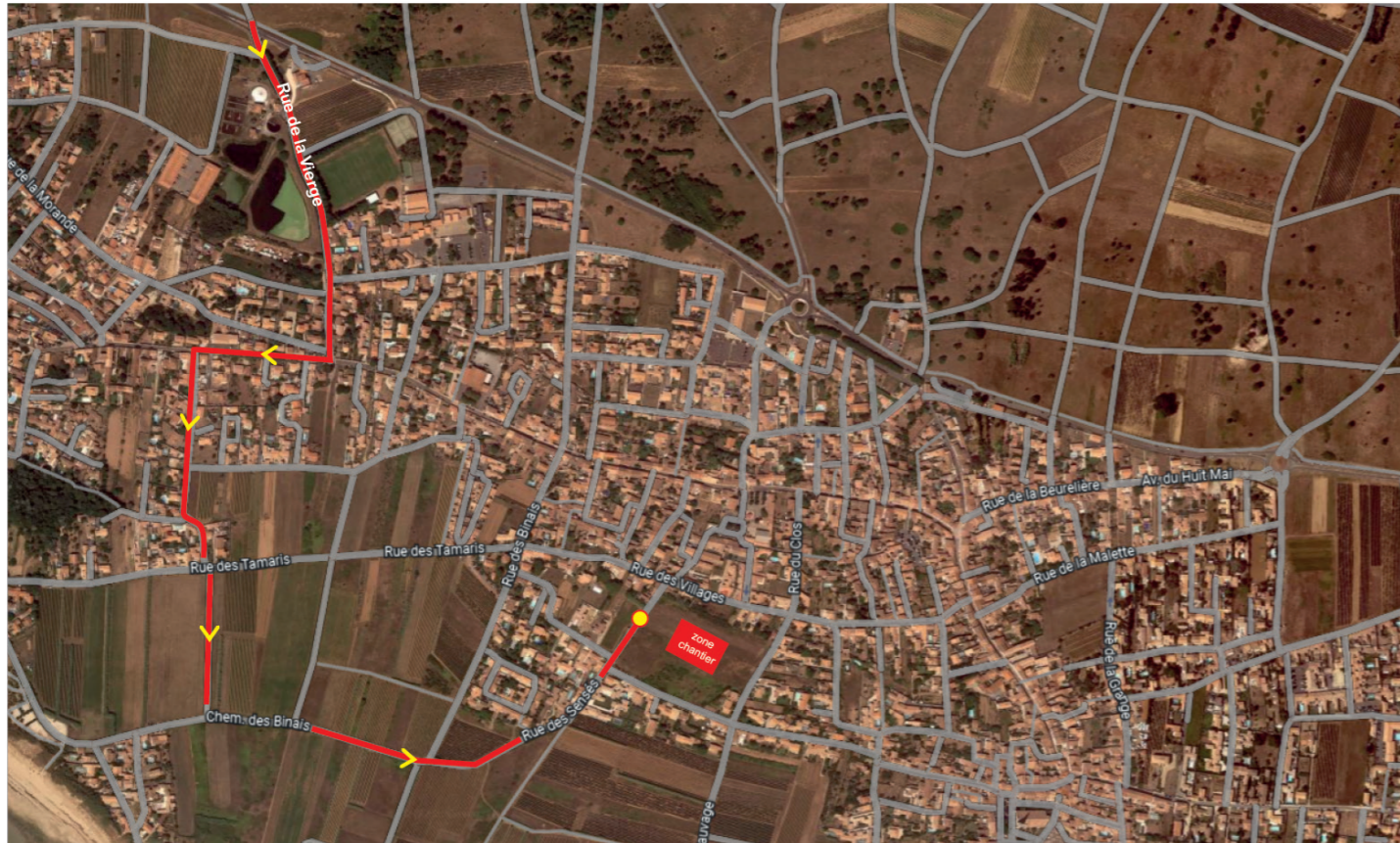
Plan de circulation des engins de chantiers